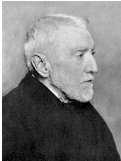
هنري فولدز Henry Faulds (١٨٤٣-١٩٣٠)