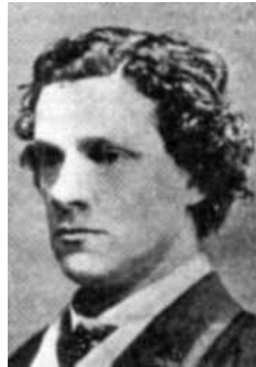
وليم هرشل William Herschel (١٨٣٣-١٩١٧)

في عام ١٨٢٣ اكتشف بركنجي Purkinje حقيقة البصمات ووجد أن الخطوط الدقيقة الموجودة في رؤوس الأصابع (البنان) تختلف من شخص لآخر، ووجد ثلاثة أنواع من هذه الخطوط: أقواس أو دوائر أو عقد أو على شكل رابع يدعى المركبات، لتركيبتها من أشكال متعددة، وفي عام ١٨٥٨ أشار وليم هرشل William Herschel (١٨٣٣-١٩١٧) إلى اختلاف البصمات باختلاف أصحابها، مما جعلها دليلاً مميزاً لكل شخص، وفي عام ١٨٧٧ اخترع هنري فولدز Henry Faulds (١٨٤٣-١٩٣٠) طريقة وضع البصمة على الورق باستخدام حبر المطابع.