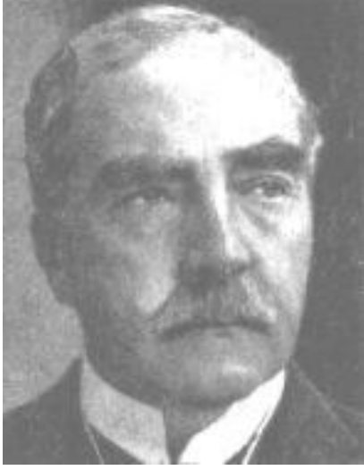
إدوارد هنري Edward Henry (١٨٥٠-١٩٣١)